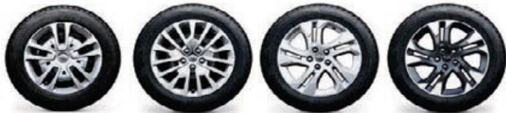
16" Black steel wheels with full wheel 17" Black steel wheels with full wheel 17" Silver alloy wheels with chrome 17" Bi-colour diamond cut alloy